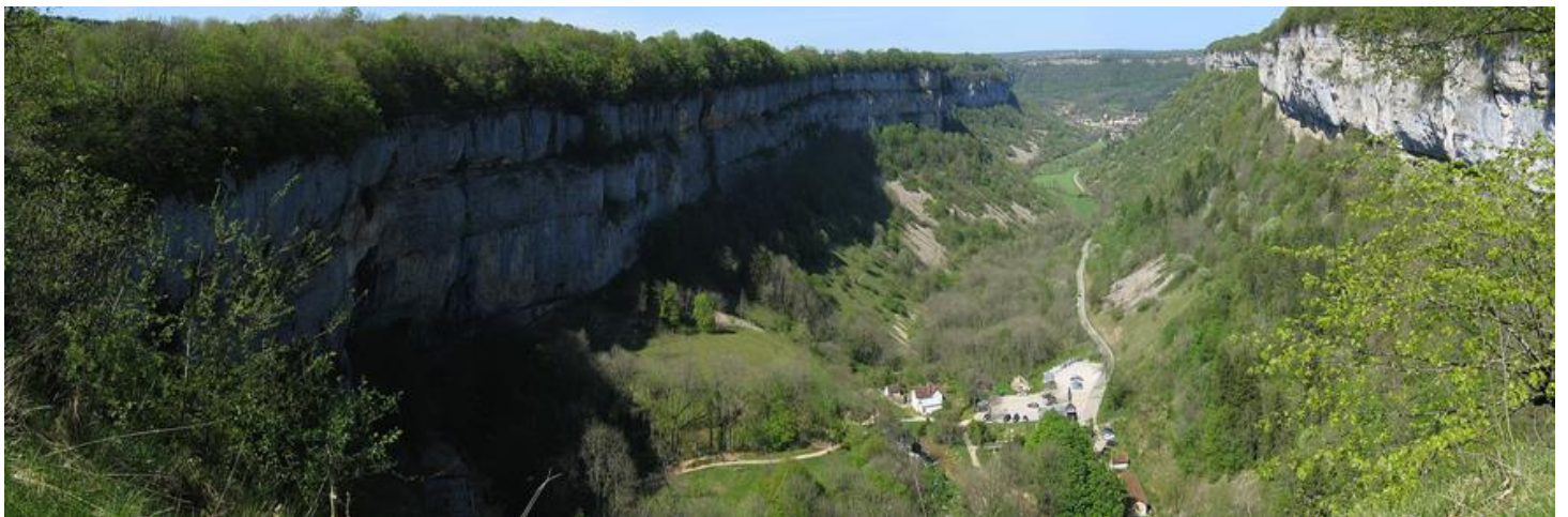
Vue de la reculée des planches depuis le fer à cheval, Les Planches-près-Arbois (Jura), Chalumeau Laurent, 2019