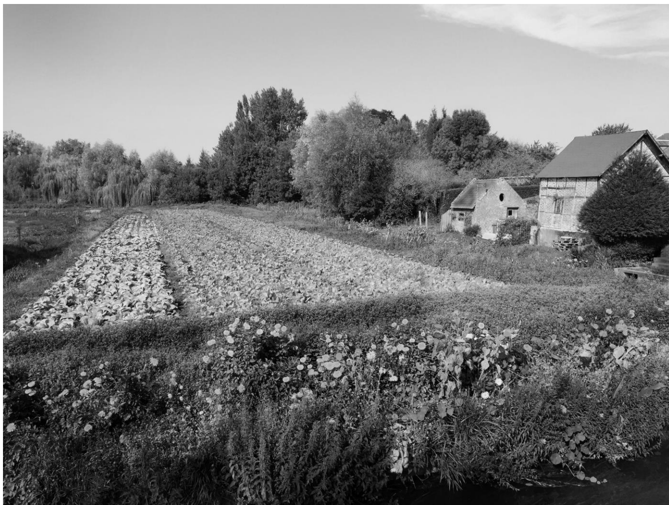
Les hortillonnages, Amiens, Jean-Marc Hoeblich, 2015