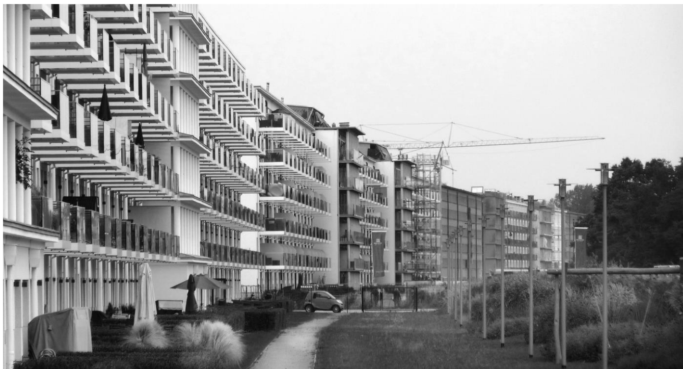
Réhabilitation d'un complexe touristique nazi de Prora (Allemagne), Lauriane Létocart