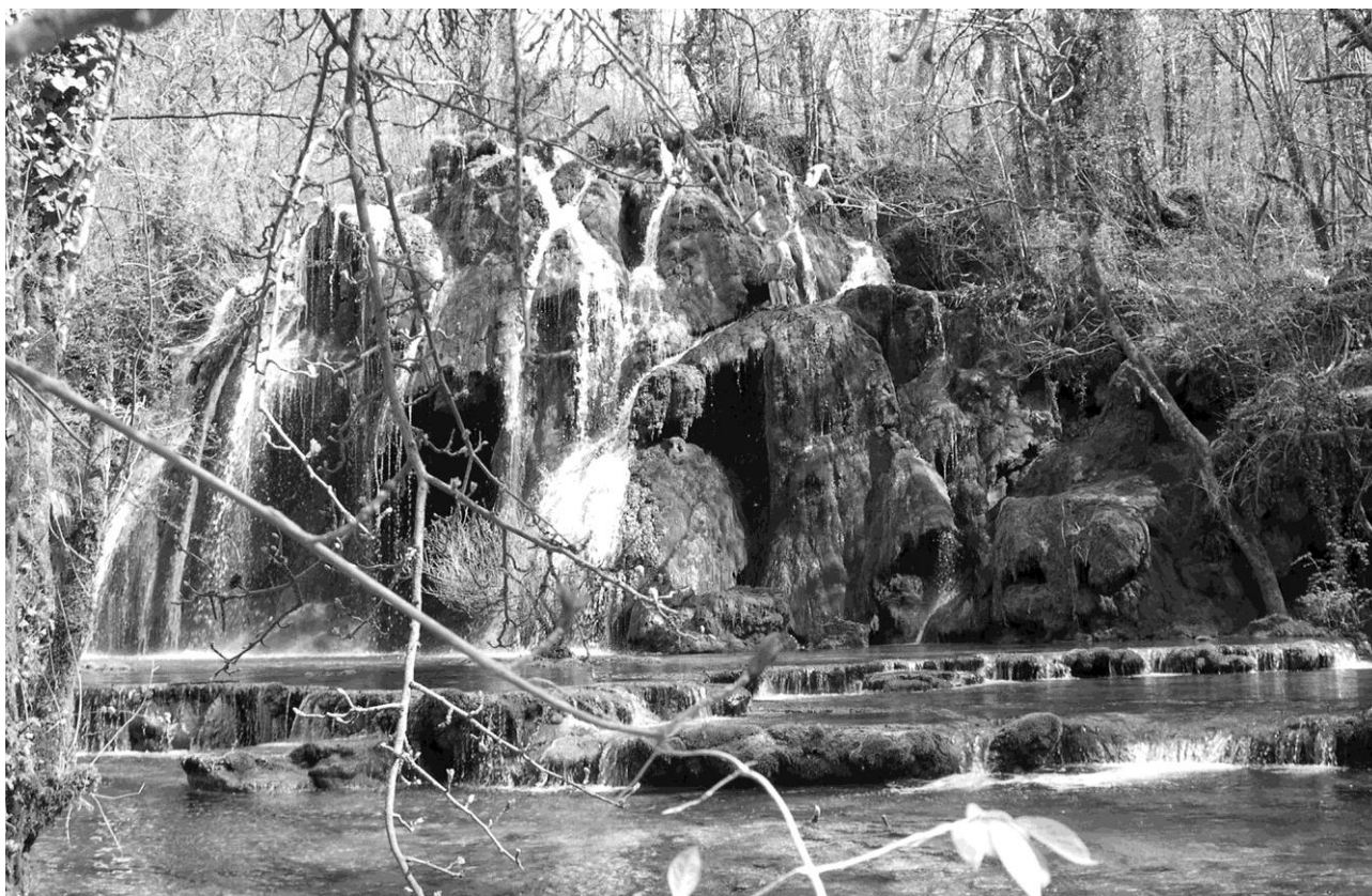
Travertin de la reculée des planches, Les Planches-près-Arbois, Laurent Chalumeau, 2006